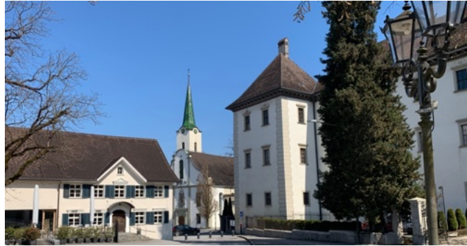
Schlossplatz Hohenems