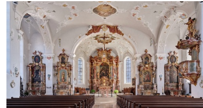
Stadtpfarrkirche St. Gallus

Treffpunkt: vor dem Festspielhaus, Weg barrierefrei Bodenseeguide: Armin Heim