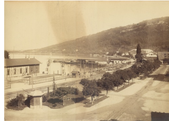
Bregenz Hafen mit Bahnverladeanlage um 1875