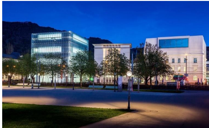
Bregenz Kulturhäuser